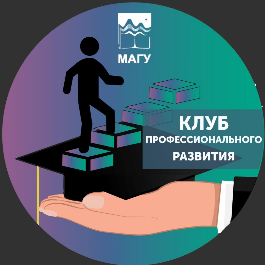
● Логотип клуба